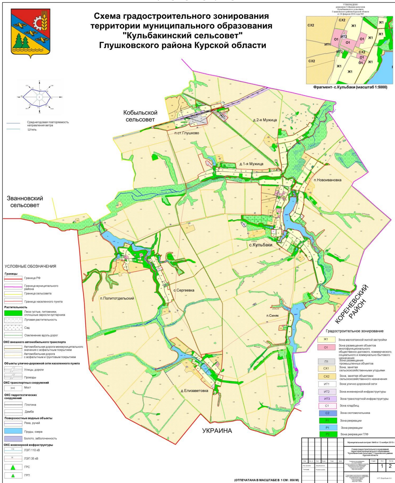
Рис.1. Схема градостроительного зонирования территории муниципального образования «Кульбакинский сельсовет» Глушковского района Курской области